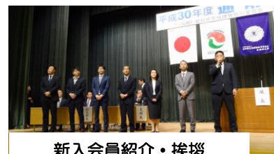
新入会員紹介・挨拶